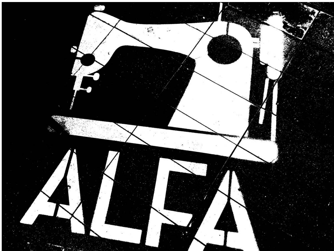
Eibarko industriaren museoko ekimena