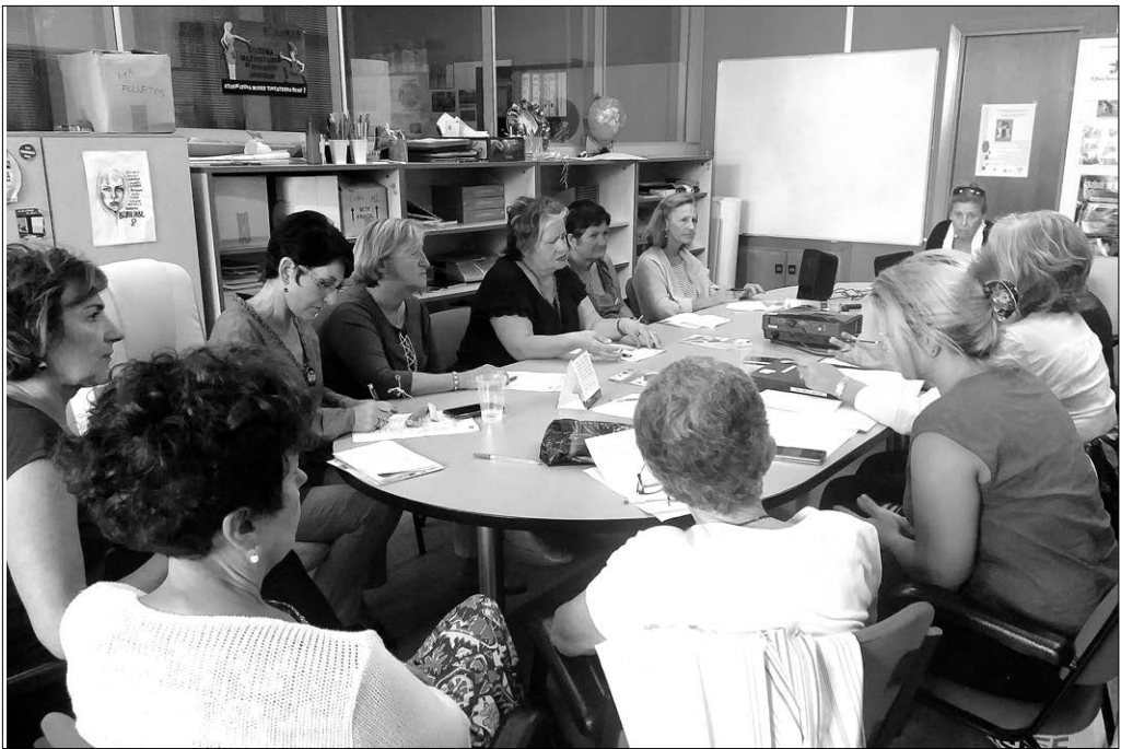
Emakumearen Mahaiaren bilera