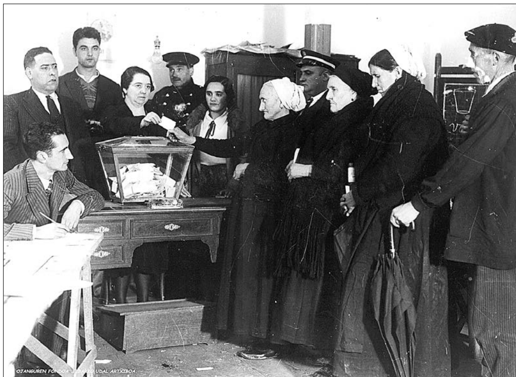
Eibarko emakumeek bozkatzeko aukera izan zuten lehen aldia, Espainian 1931n boto femeninoa onartu ondoren. Lehen Euskal Estatutuaren bozketa, 1933-11-5.