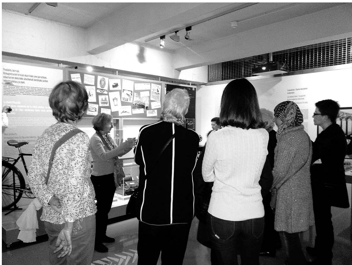
Memoria kolektiboa lantzeko saioa. Eibarko industriaren museora egindako bisita

tsona desgaituentzat proiektu baten buru izan ziren emakumeen ahalegina dugu, eta bestetik, eurentzat eta beste emakume batzuentzat «bidea egin» zuten emakumeen eguneroko zereginak eta borroka ditugu, zeinak baldintza mesedegarriak ekarri zituzten emakumeak ahalduzko. Kasu bietan laguntzen da testuinguru irekiago, inklusiboago eta berdina eraikitzen.