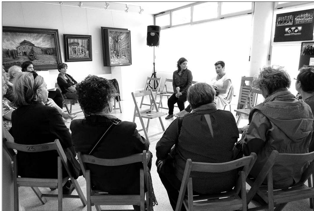
Memoria kolektiboa lantzeko saioetako lan-prozesua

Proiektu hau era parte-hartzailean burutu zen, eta bide ezberdinetatik egin ziren deialdia eta zabalkundea: iragarki-taulak, webguneak, tokiko egunkari eta aldizkariak, irratsaioak... Hainbat emakumek egin zuten bat deialdiarekin, eta urtebetean, batzuk modu puntaletan eta beste batzuk saio guztietan, (2014ko abendutik 2015eko abendura arte) oroitzeke saio kolektiboetan hartu zuten parte, euren oroitzapenak, ezagutza eta ikuspuntuak partekatzeko. Taldean partekatu, egiaztatu eta testuingururatu zituzten kontakizun ezberdinak, biografia indibidualak, esperientzia pertsonalak, lanekoak, taldekoak eta belaunaldiakoak, eta hainbat hamarkadatan Eiba-