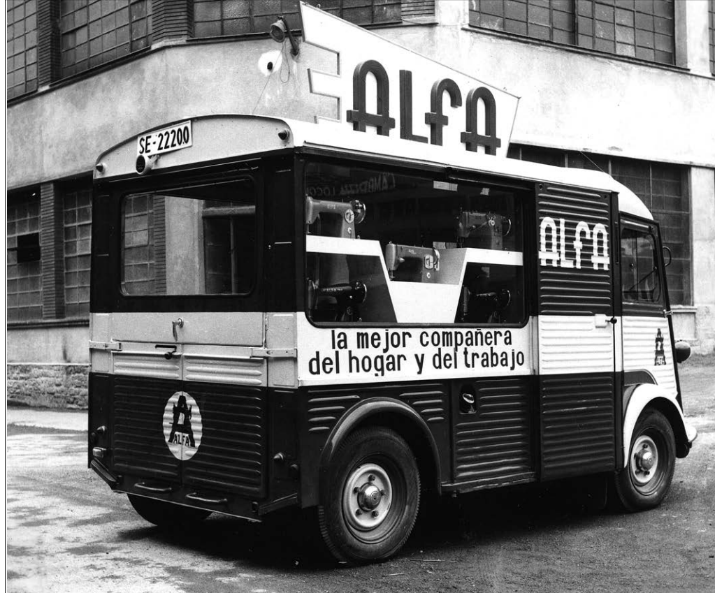
1961. urtea. Erakusketa furgoneta. ALFA.

presa paradigmaticoa bilakatu zen, «sokratua» eta «lantegi-kontzeptua aldatu zuen»; baina Alfaz gain, egon dira ospe eta ahalera handiko beste enpresa batzuk ere.