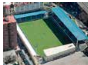
Imagen aérea del campo de Ipurua

o la Unión Deportiva Eibarresa se sumarán a la afición por el fútbol. De este último club surgieron tres internacionales por España, casos de Ciriaco, Errasti y Muguerza. Ya en los años veinte siguen apareciendo nuevos clubes, casos del Lagun Artea, el Club Altza Praka, el Eibar Sport, la Unión Sporting Club o el C.D. Gallo.