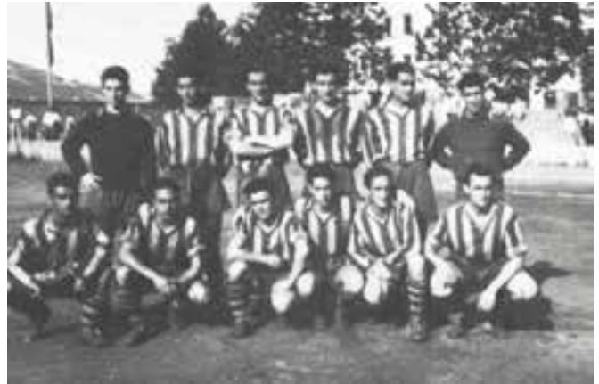
SD Eibar taldea Ipuruan, 52/53 denboraldia

Mailako bere taldeko txapelkun zein txapelkunorde izateagatik, baina porrotak etengabeak izan ziren.