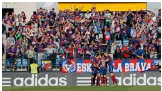
19 de abril de 2014, gol contra el Real Madrid B