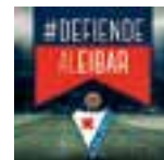
Eibar Kirol Elkartearen logoa fondoak eskuratzeko. "Eibar defendatu"