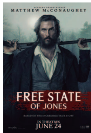
LOS HOMBRES LIBRES DE JONES