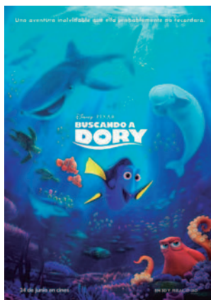
BUSCANDO A DORY