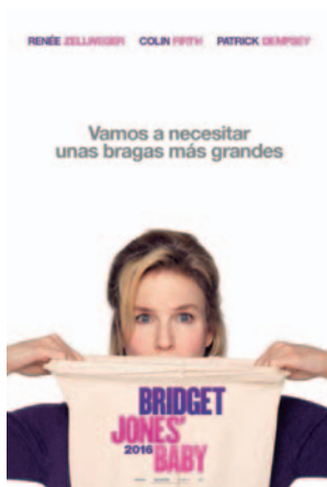
BRIDGET JONES' BABY